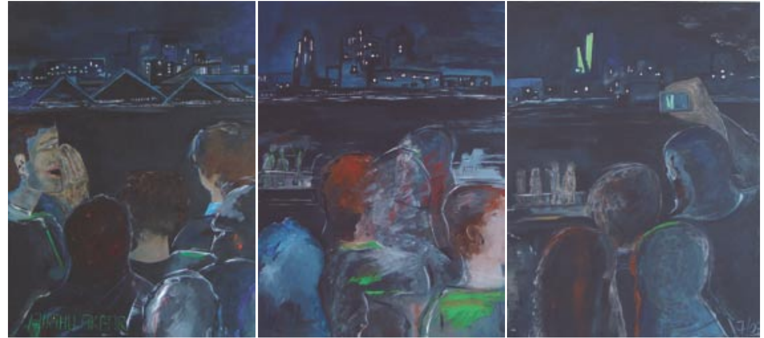
Allahu akbar 1-3, jeweils 80 x 60, Acryl auf Leinwand (2009)