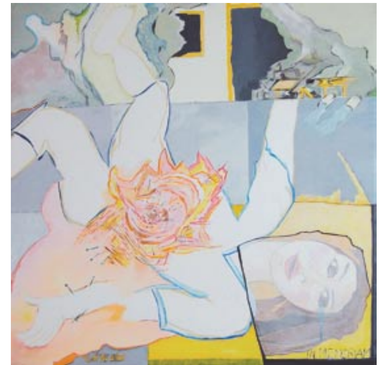
Mit Näglein bestückt, 60 x 60, Acryl auf Leinwand (2007/2009)