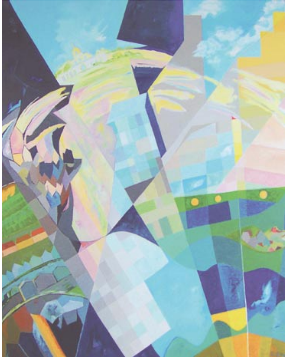
FOR SALE: Stadtlandschaft 2009, 110 x 90, Acryl auf Leinwand (2009)