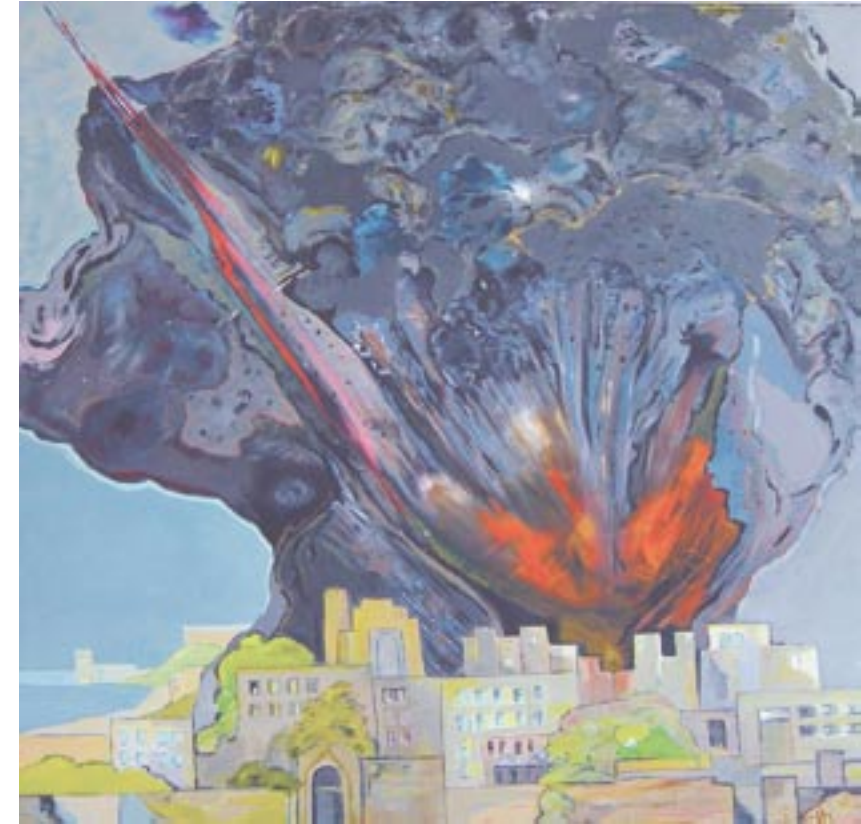
Fleurs du Mal 2, 60 x 60, Acryl auf Leinwand (2007/2009)