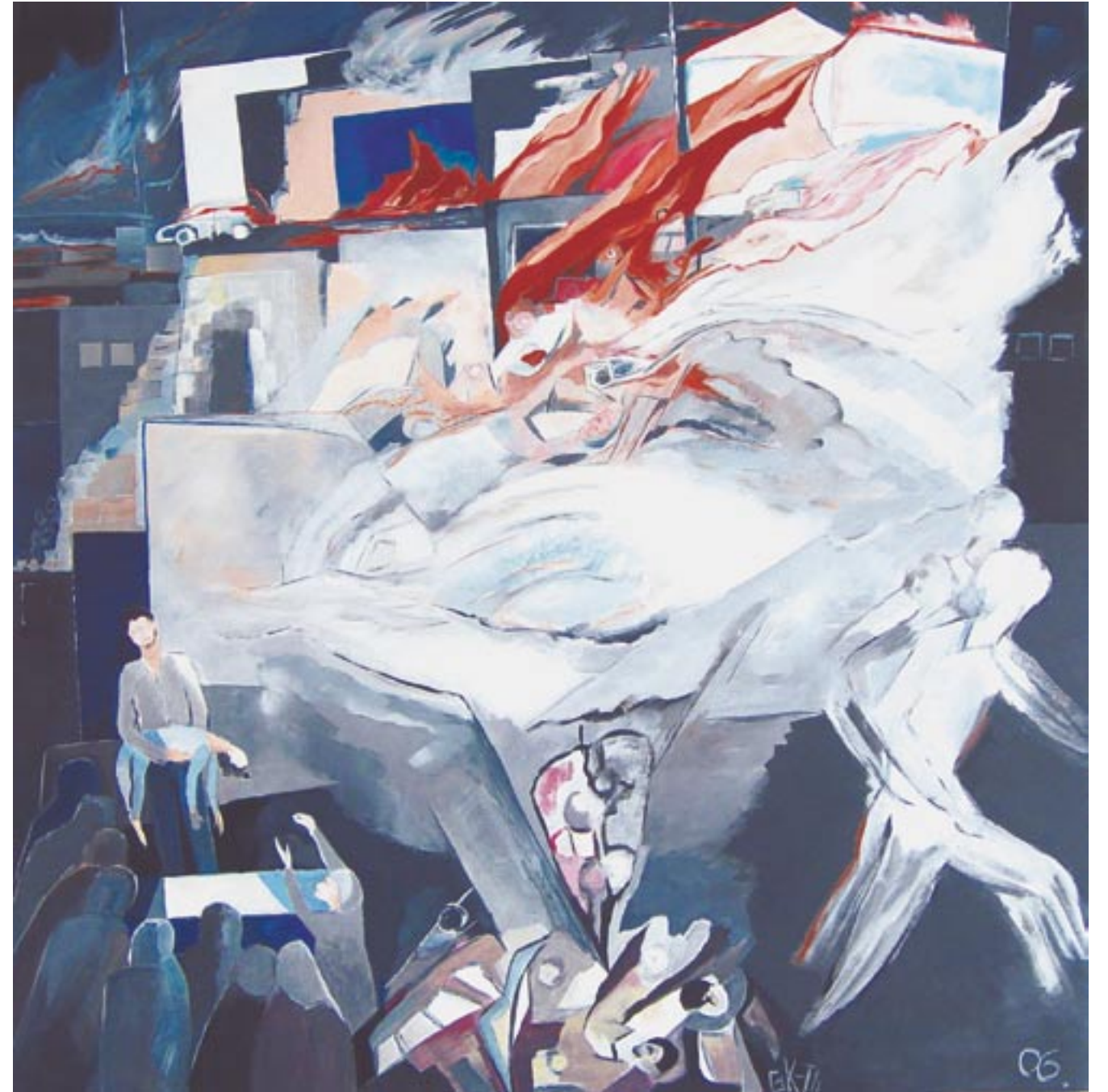
Ade, kleiner Wohlstand, 90 x 90, Acryl auf Leinwand (2006)