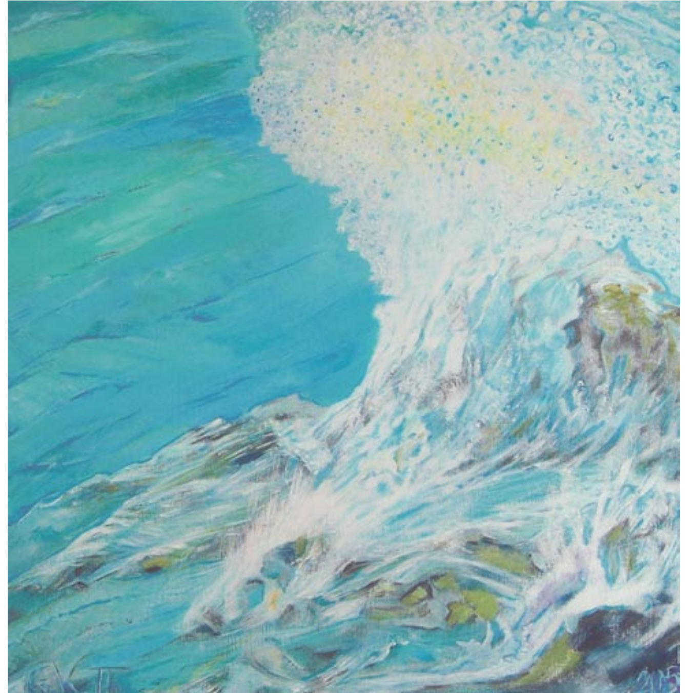
Welle, 80 x 80, Acryl auf Leinwand (2005)