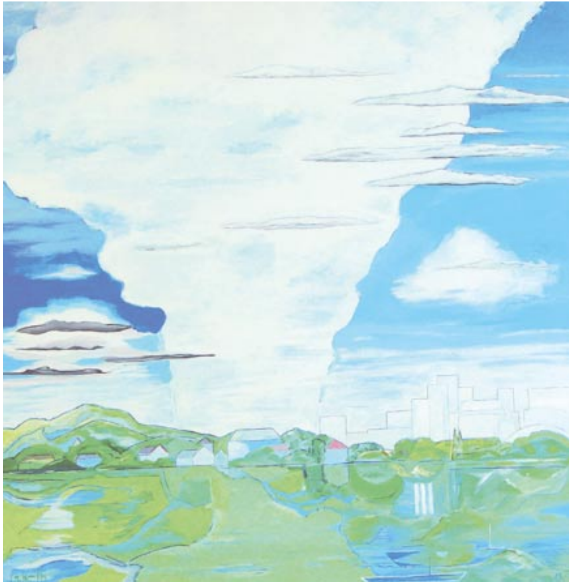
Morgen regnet sich der Himmel aus, 80 x 80, Acryl auf Leinwand (2008)