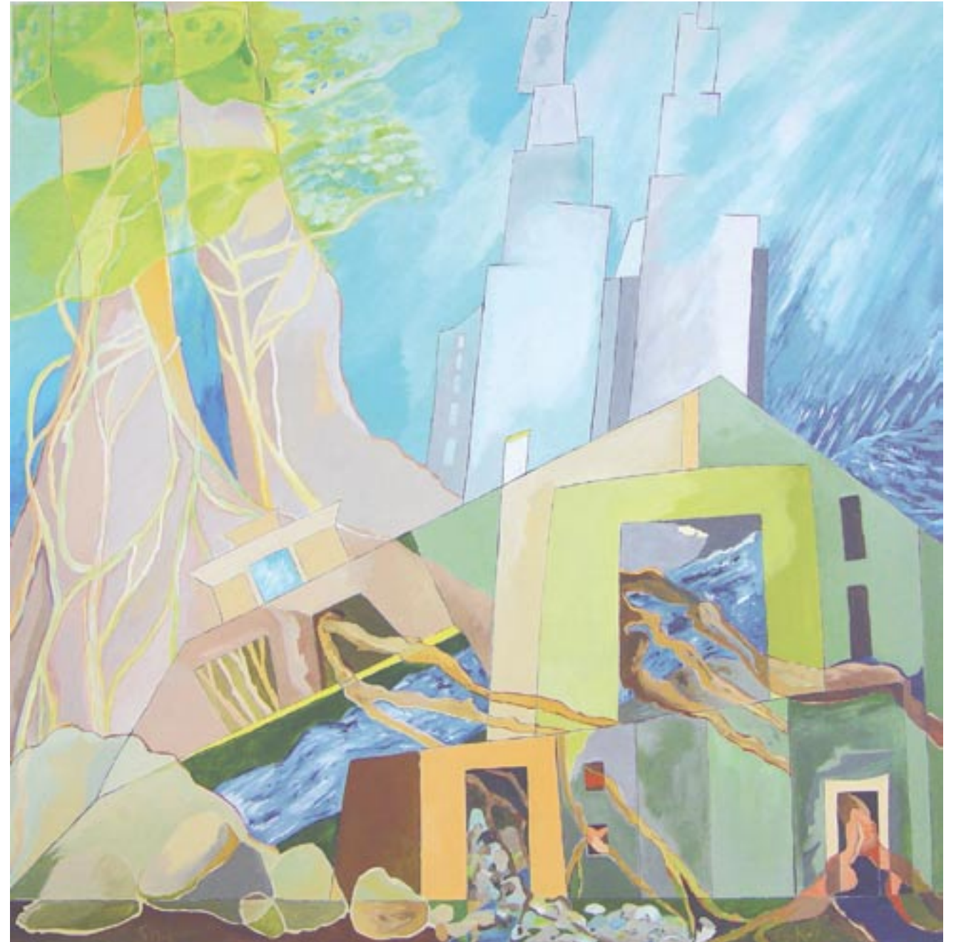
Zurück zur Natur, 100 x 100, Acryl auf Leinwand (2008)

„C'est un des privilèges prodigieux de l'Art que l'horrible, artistement exprimé, devienne beauté, et que la douleur rythmée et cadencée remplisse l'esprit d'une joie calme.“, Charles Baudelaire: OC II, S. 123 (Critique littéraire)