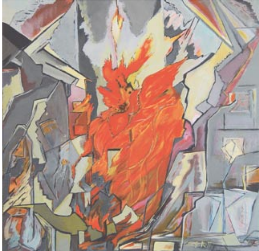
Fleurs du Mal 1, 60 x 60, Acryl auf Leinwand (2007/2009)