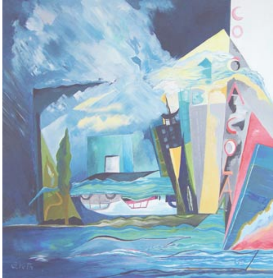
Wasserstadt, 80 x 80, Acryl auf Leinwand (2005)