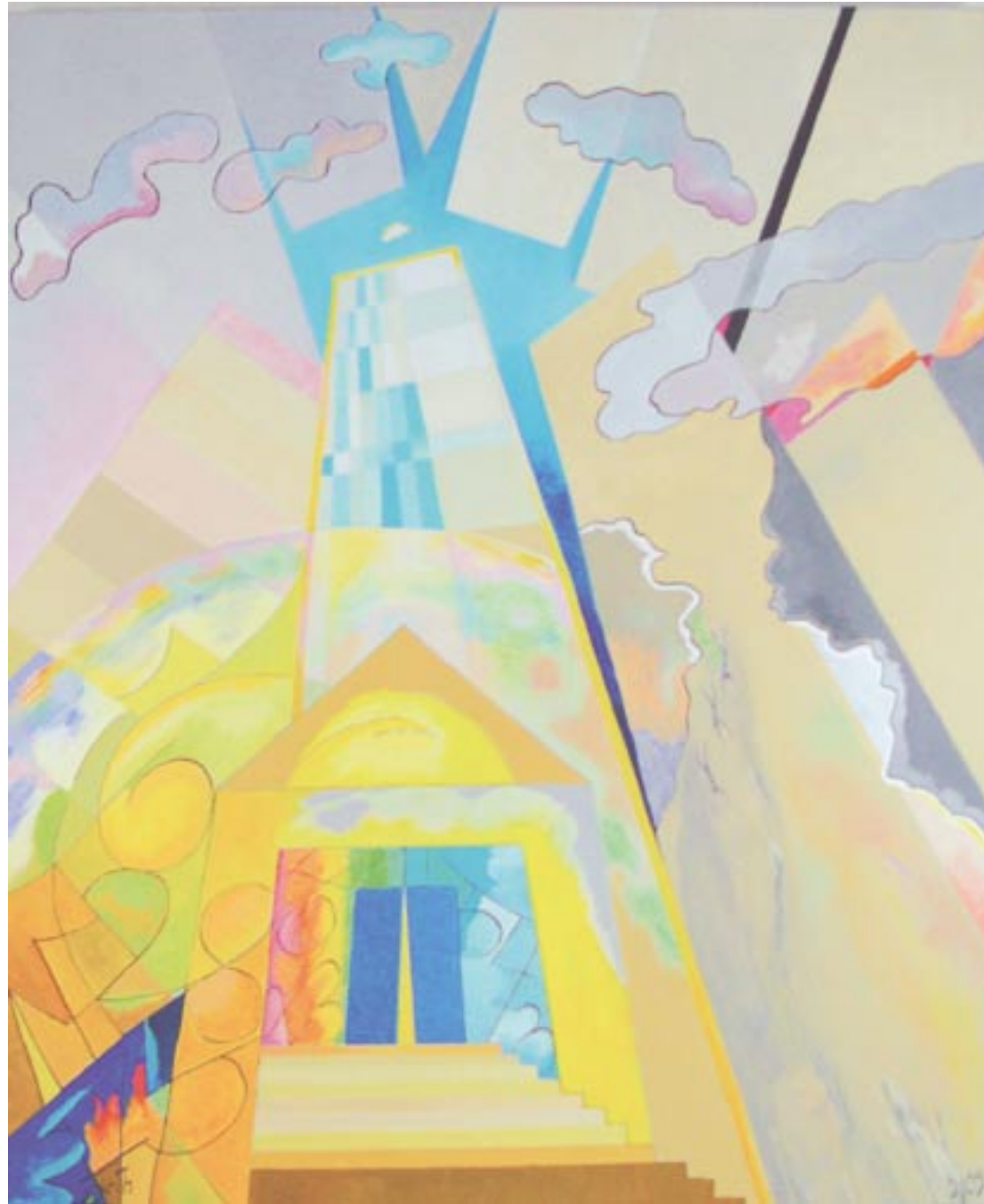
Magie der Zahlen, 110 x 90, Acryl auf Leinwand (2009)