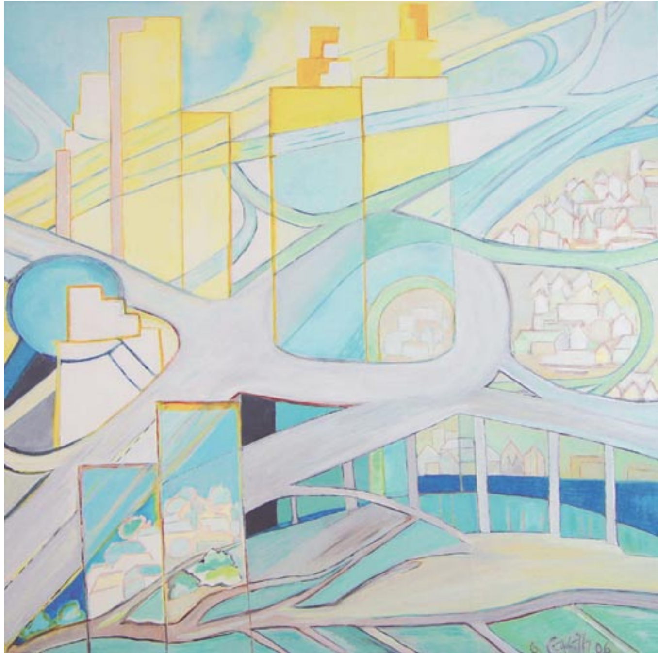
High Ways, 80 x 80, Acryl auf Leinwand (2006)