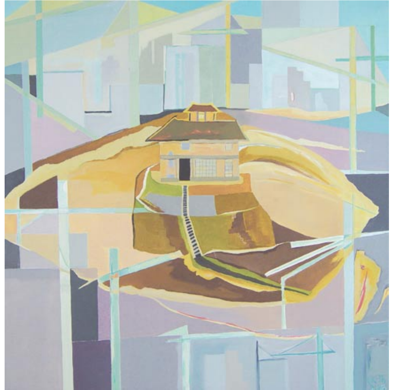
Potala 2, 80 x 80, Acryl auf Leinwand (2008)