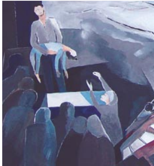
Ausschnitte aus: Ade, kleiner Wohlstand, 90 x 90, Acryl auf Leinwand (2006)