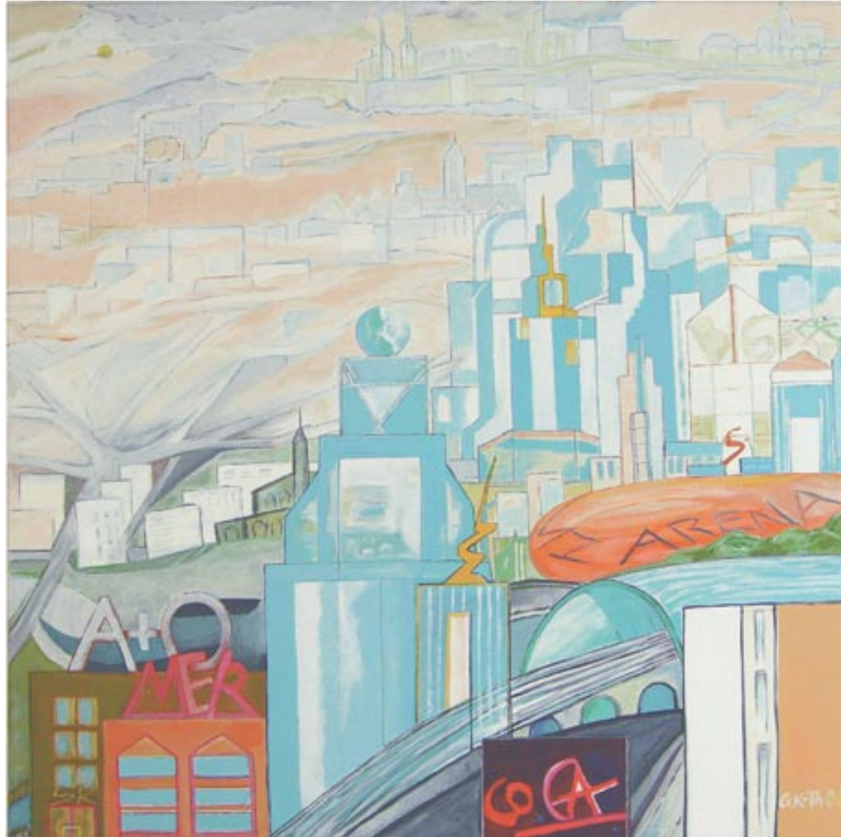
City, 90 x 90, Acryl auf Leinwand (2006)