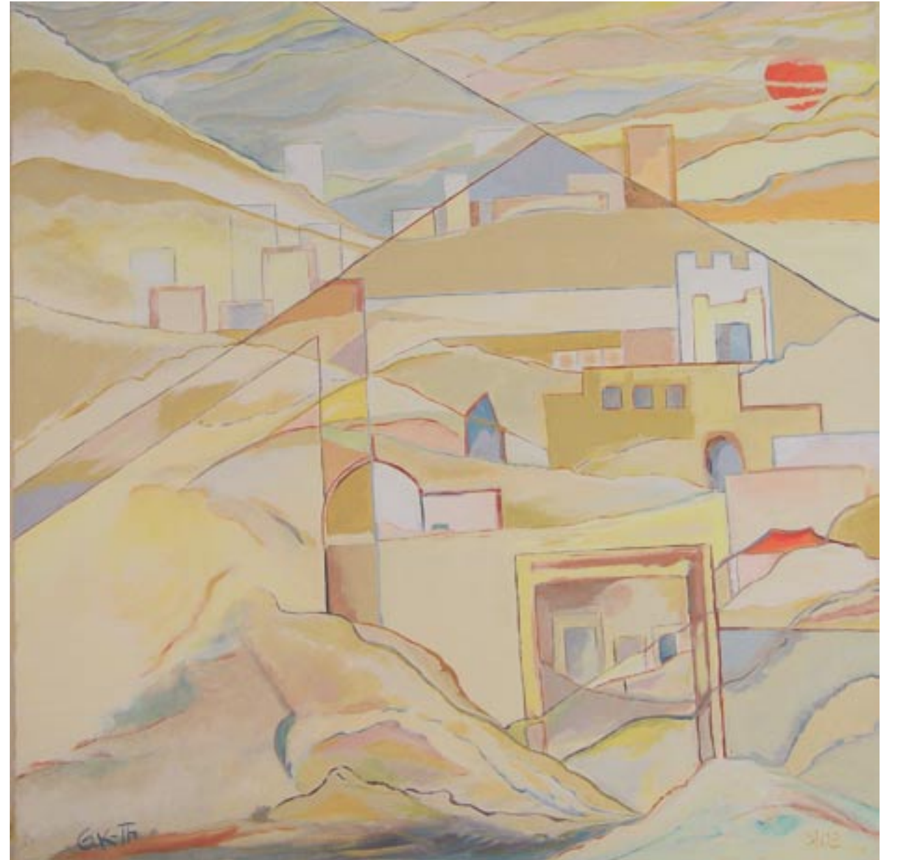
Sand, 80 x 80, Acryl auf Leinwand (2008)