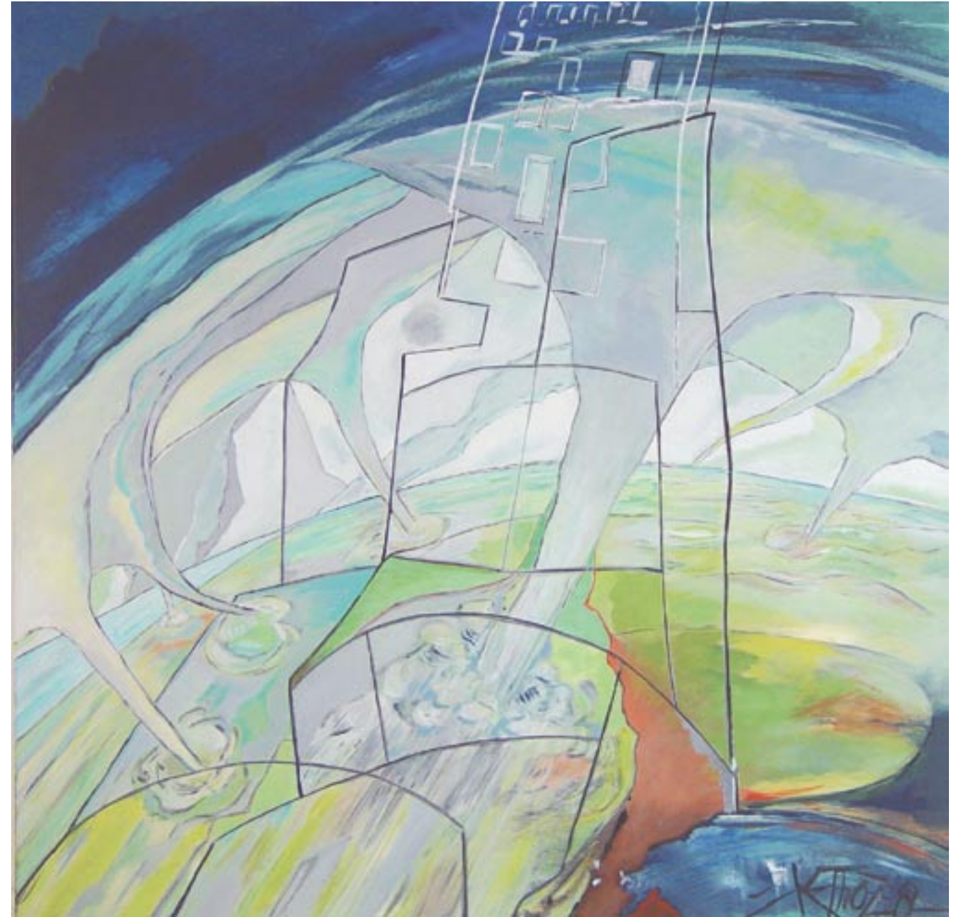
Tornado, 80 x 80, Acryl auf Leinwand (2008)