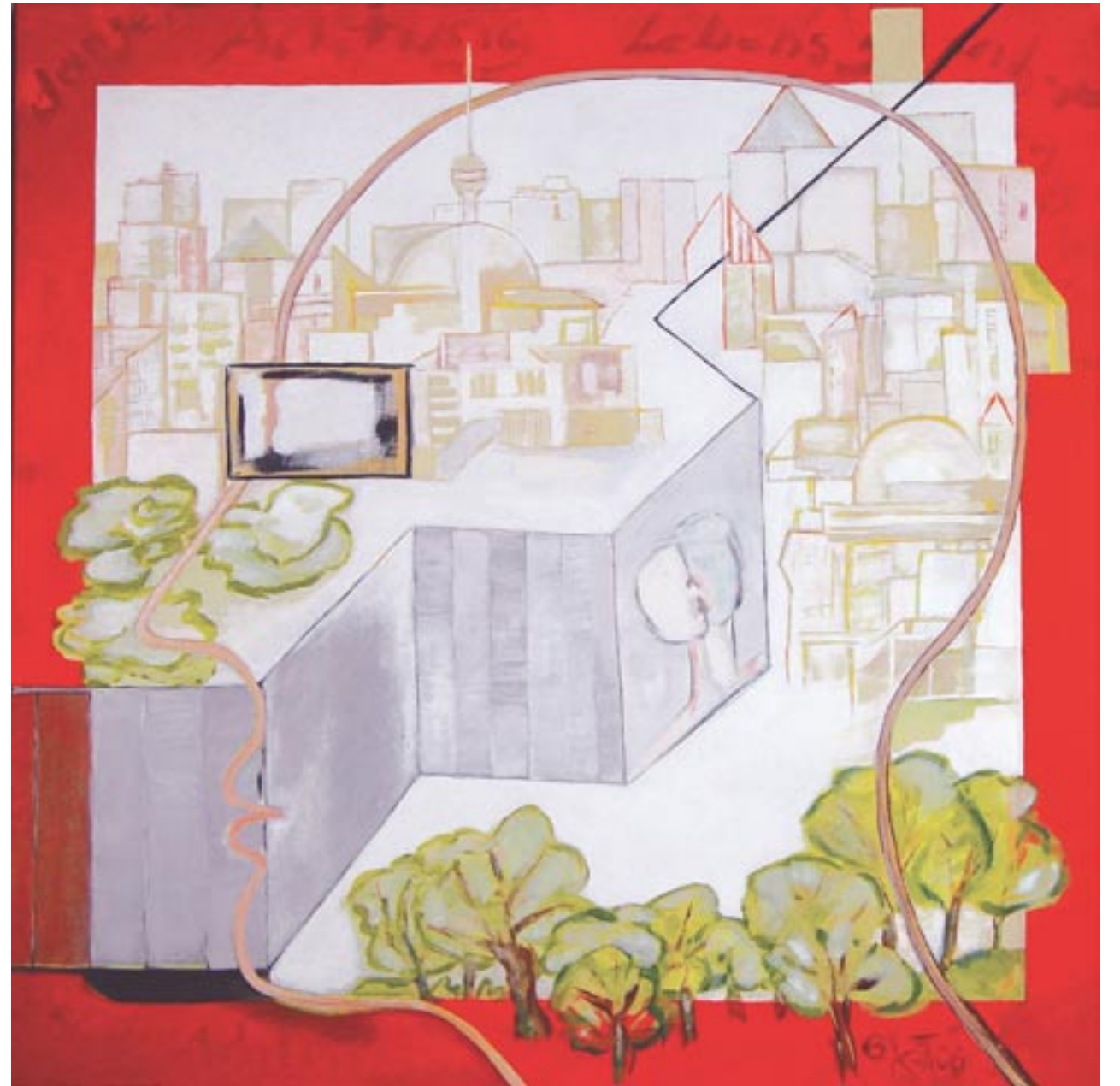
Mauer, 80 x 80, Acryl auf Leinwand (2006)