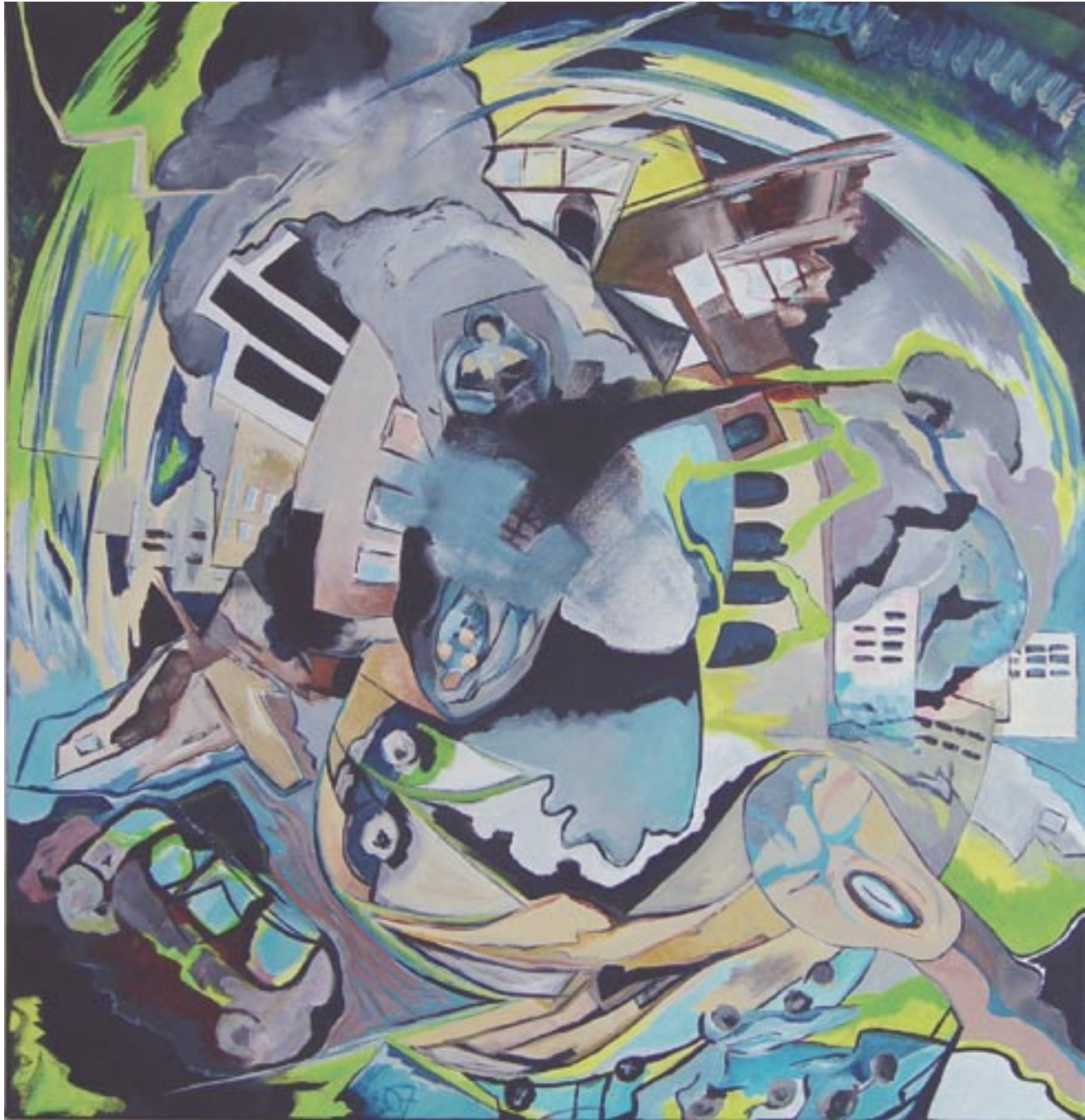
Was ist oben, was unten, 80 x 80, Acryl auf Leinwand (2007)