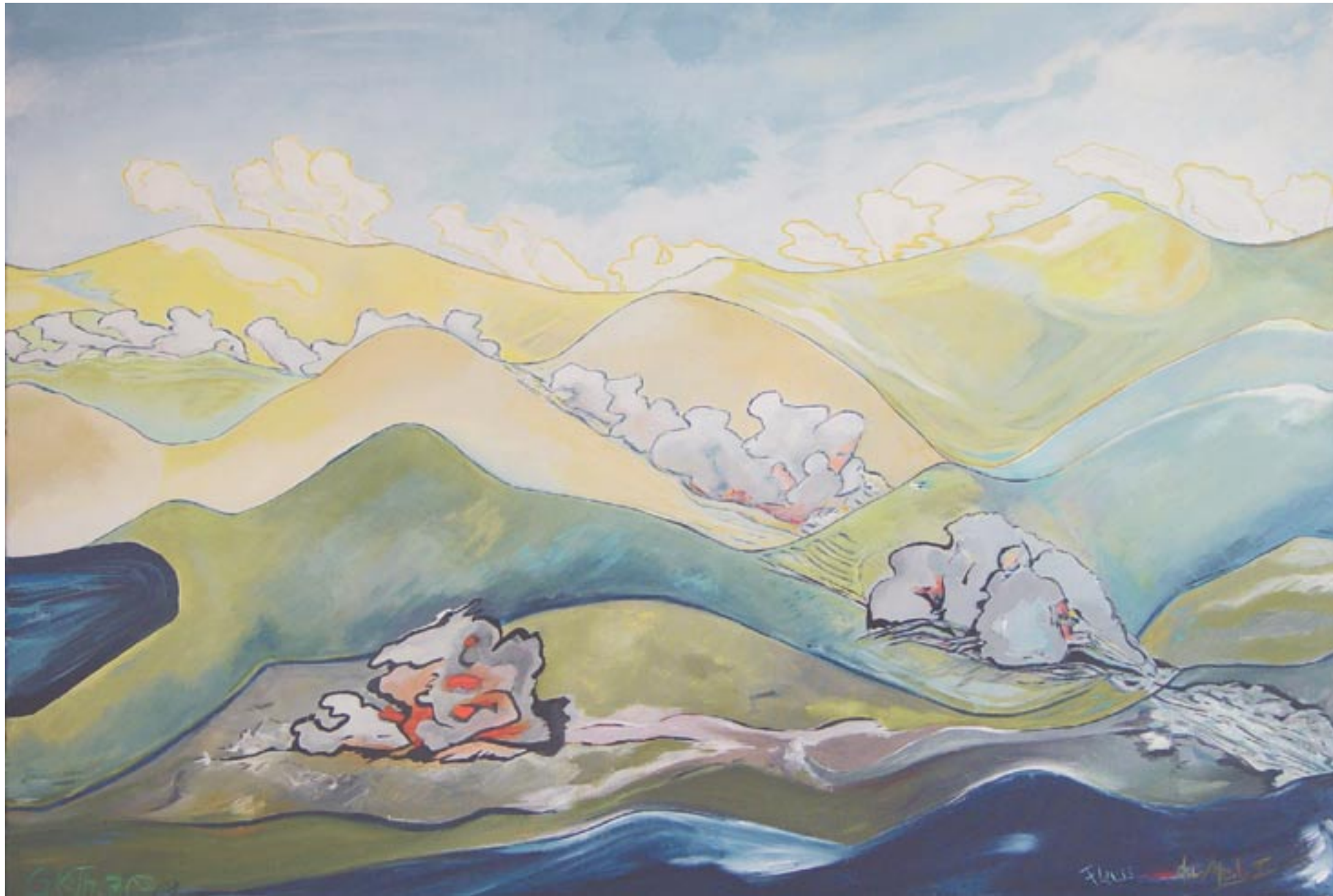
Gegenläufig, 80 x 120, Acryl auf Leinwand (2007/2009)