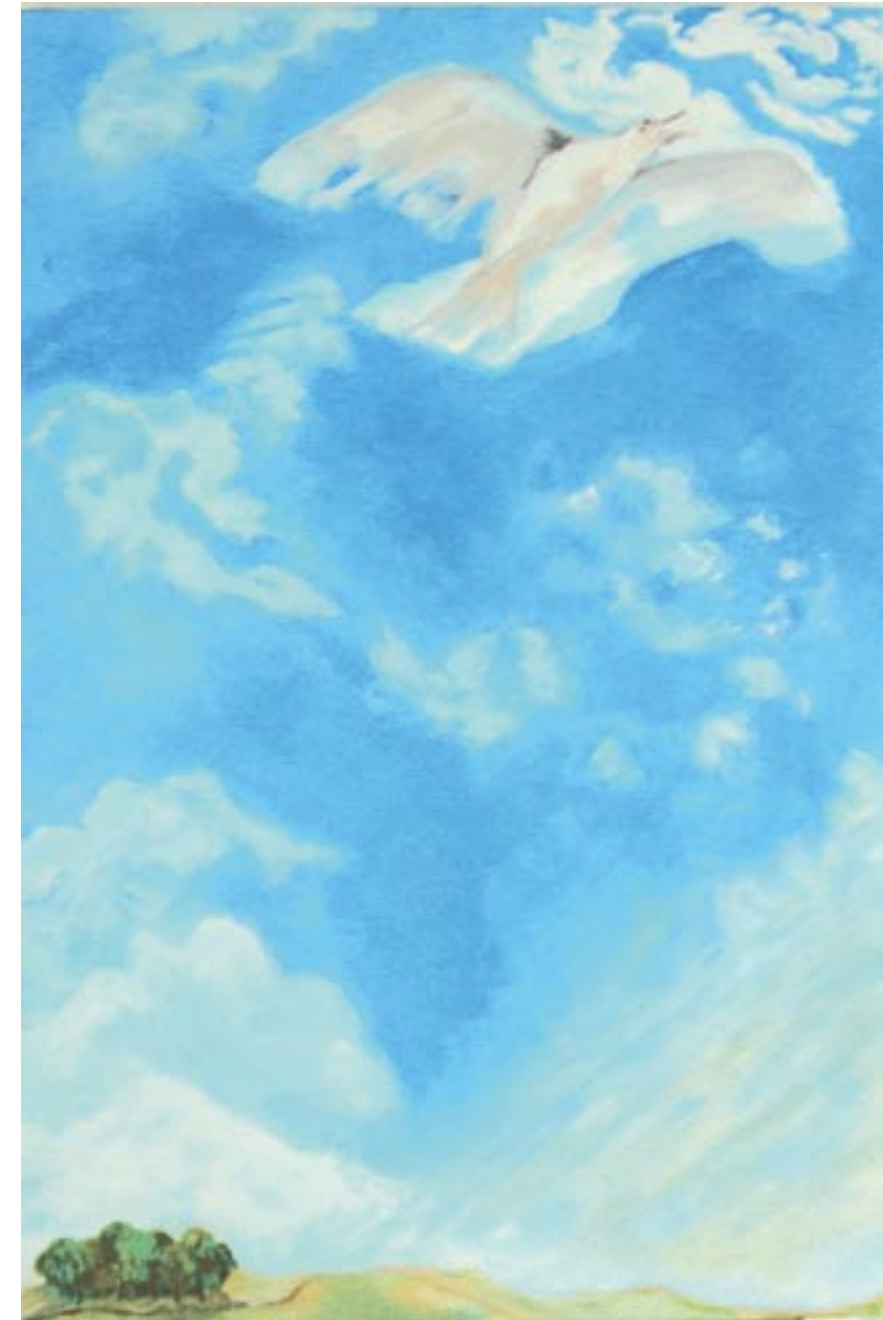
Von der Lust zu singen, 120 x 80, Acryl auf Leinwand (2003)